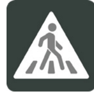
Pas de vianants