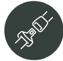
Cinturó de seguretat