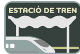
Estació de tren